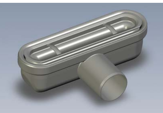
1406.0050 - Komora se sifonem*)