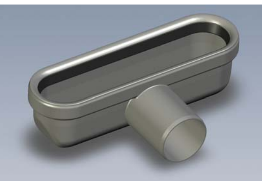
1301.0050 - Komora bez sifonu

Je vyrobena z plastu s napojením na kanalizaci o průměru 50 mm. Průtok je vyšší než 0,6 l/s.